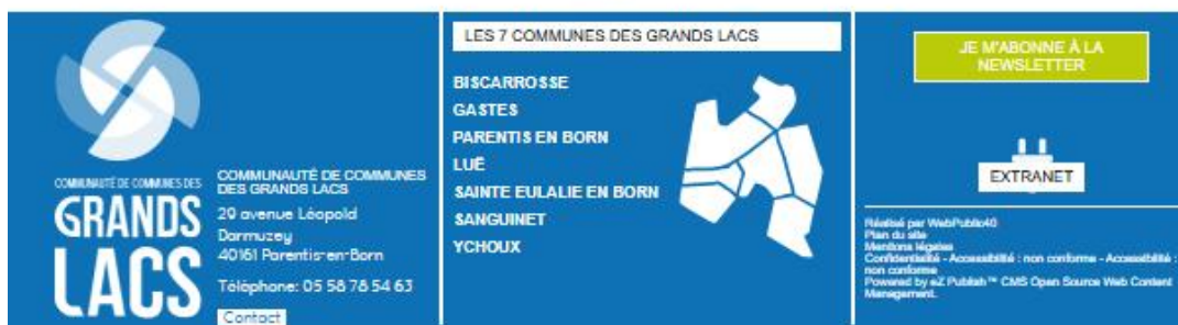
Extrait du site internet de la CC des Grands Lacs