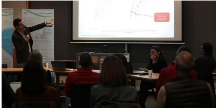
La présentation des modifications précède une enquête publique qui débutera courant février 2025.

Par Axel Frank Publié le 15/12/2024 à 11h17.